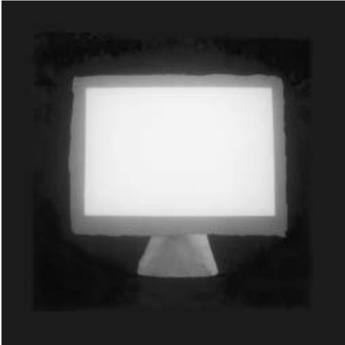
Andreas Greußlich, o.T. (Monitor), 2005, Silbergelantieneprent

Was ist ein ausgeschalteter Bildschirm? Gar nichts. Die Leere. Eine Contradiktion von sich selbst. Ein absolut unnutzbares Objekt. Eine große Enttäuschung. Eine plötzliche Verschwendung. Eine banale Materialisation der Realität.