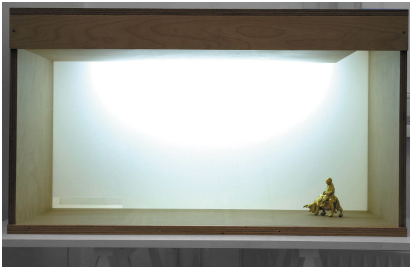
TBA, 2008 Mixed Media, 47 × 83 × 52,4 cm